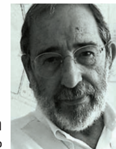
Álvaro Siza Vieira Arquitecto

Este folheto é meramente informativo. As informações nele contidas não constituem valor contratual.